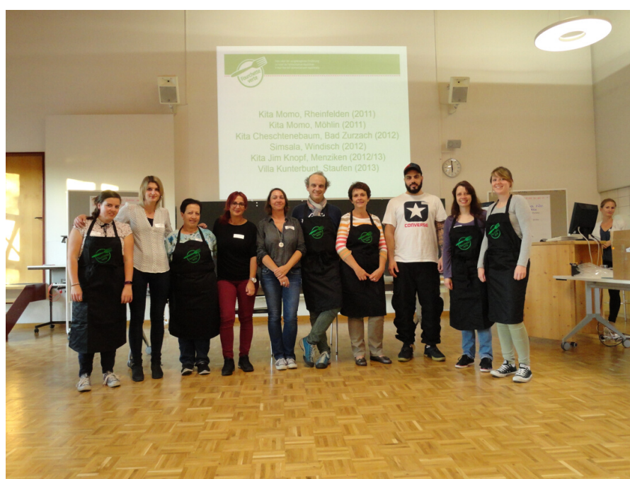
Betriebe im Kanton